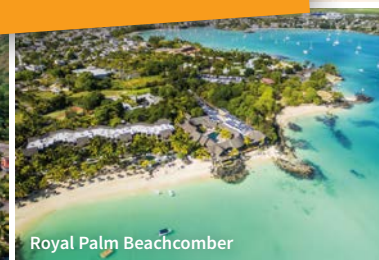
Royal Palm Beachcomber

Vols directs, taxes d'aéroport, transferts privés, 1 excursion privative et 6 nuits d'hôtels.